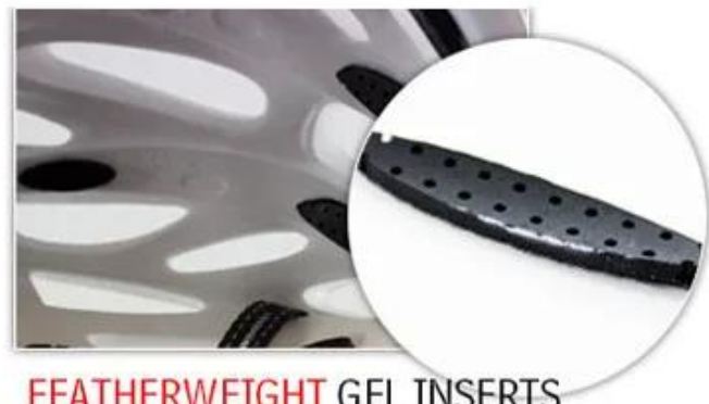
FEATHERWEIGHT GEL INSERTS

Amovible et le rembourrage anallergique lavable en maille ouverte 3D, assure un maximum confort et Mèches rapide loin douce. D'autres options comme filet anti-insectes & Amp; Refroidir rembourrage max® peut être acceptable. '-Moisture-Wicking Pads Keep Head Dry Rider