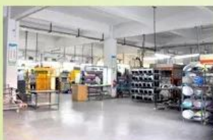
1. Helmet house

established in the year of 2012, more than 22 years experience. Expert in production of all kinds of helmets for different sports. Excellent quality, reasonable price, fast delivery makes us get very good reputation among our customers. Expert in OEM and ODM orders. Our skilled R&D team offers one stop service for throughout customers. 99% export and our main market is North America, European, Australia, Japan etc. Your enquiry is very welcomed and we will try our utmost to help you establish solid market. We are looking for long term relationship and get win win situation.