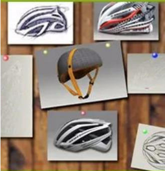
1. Trend predictions

Our in-house design facility coupled with our creative Account team enables us to create innovative helmets ideally suited to our clients target market - the company combines creativity and sourcing in a unique partnership to bring the best to any sports campaign.