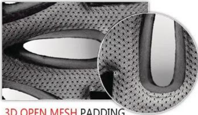
3D OPEN MESH PADDING