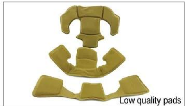
Low quality pads

Là sont les différents types de tampons internes pour votre choix. est d'abord ouverte 3D rembourrage maillé, il nécessaire d'ouvrir un moule de pressage à chaud; second est cool max padding, nous avons besoin d'acheter pad de la compagnie max cool avec MOQ 1000 verges, troisième est ANTI-INSECTES net, ce qui pourrait empêcher petit bug d'entrer dans votre casque au crépuscule, selon celui-ci est inserts gel plume, pas cher et tampons de faible qualité.