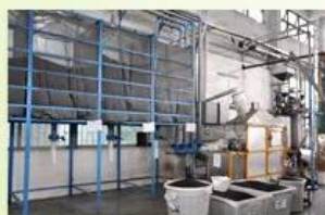
6. raw EPS material