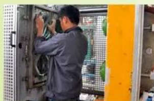
4. In-Mold producing process