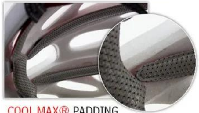
COOL MAX® PADDING