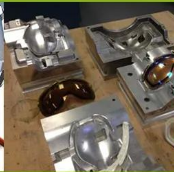
3. Development Stage