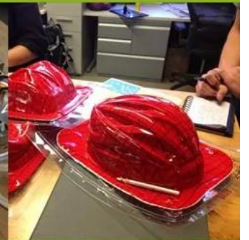
4. Final Production Stage