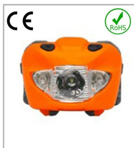
Versatile LED headlight 3A EN 61547:2009