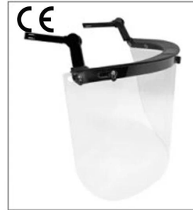
EN 166 ANSI Z87.1