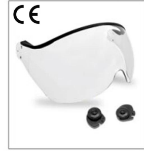
New deve loped clear visor EN266