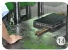
Inner padding production