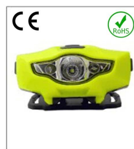
Versatile LED headlight 1A EN 55015: 2006

Les photos détaillées du casque de sécurité :