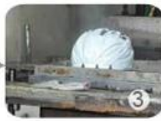
PC blister manufacture