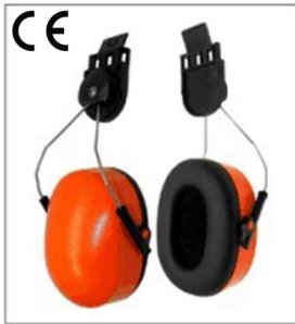
Noiseproof earmuff EN 352-3:2002