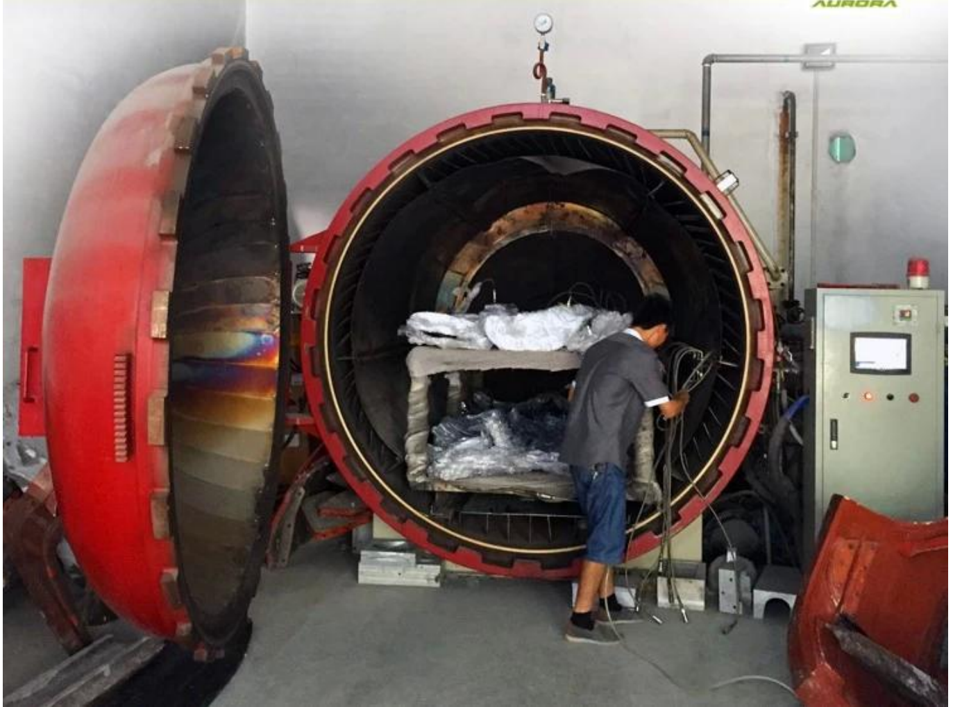
Raw Material Show: