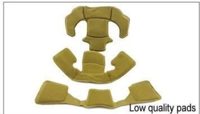
Low quality pads

Il y a différents types de garnitures intérieures pour votre choix.