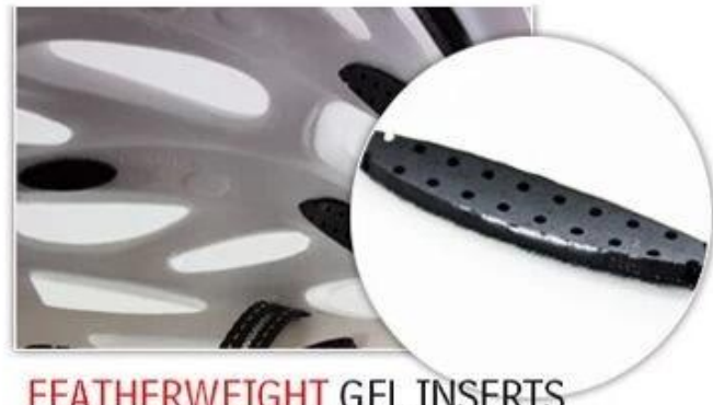
FEATHERWEIGHT GEL INSERTS