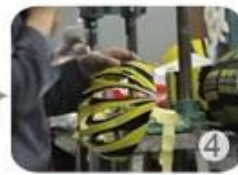
Trimming dug hole