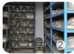
PC blister tooling