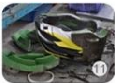
semi-finished In-mold helmet