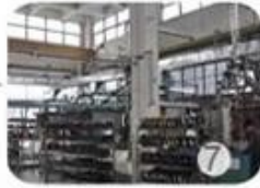
Helmet in-mold workshop