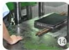
Inner padding production