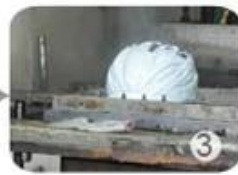
PC blister manufacture