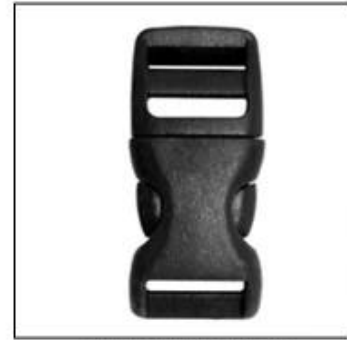
Traditional helmet buckle