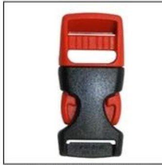
ITW standard helmet buckle