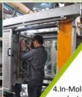
4. In-Mold producing process