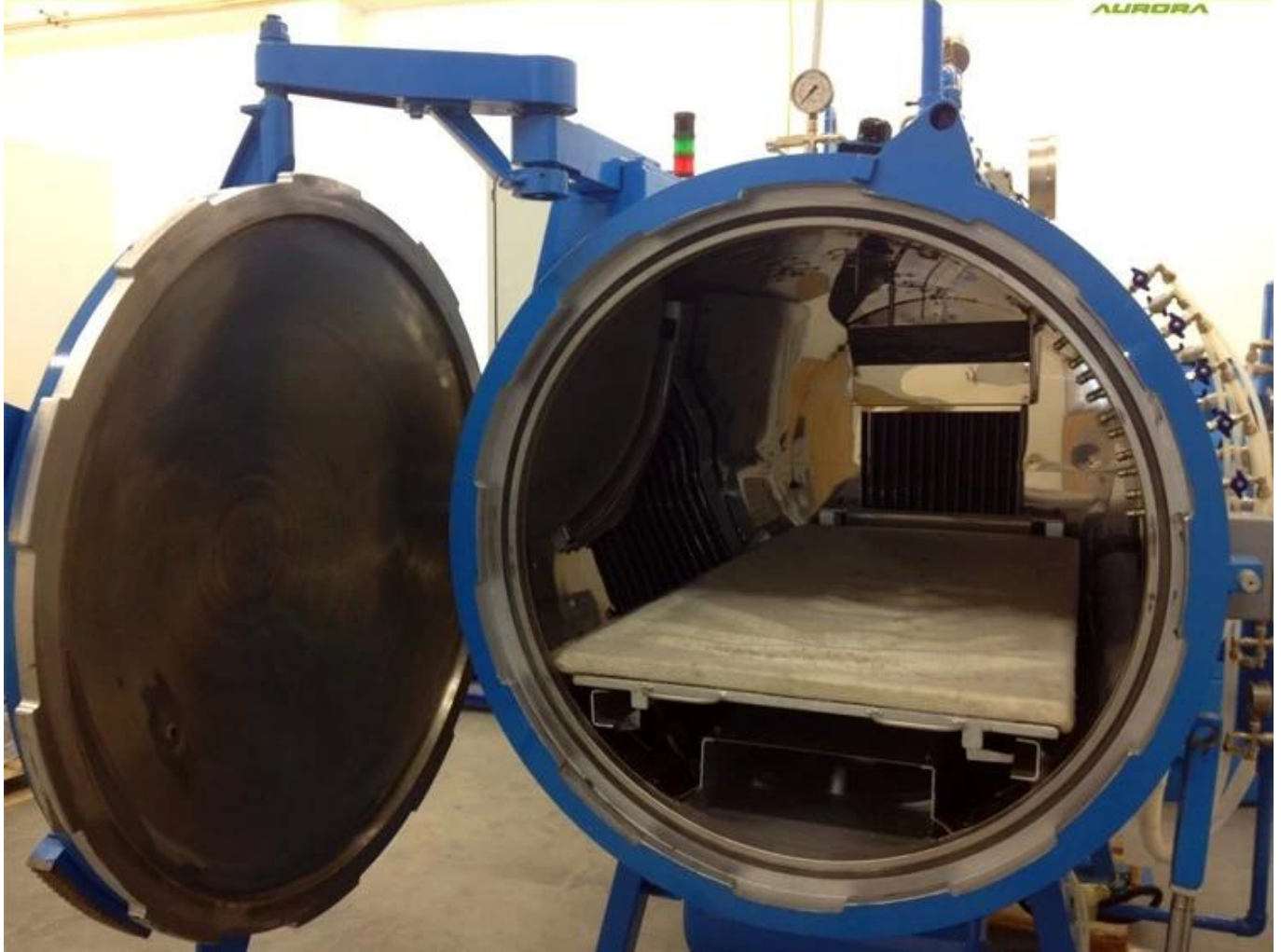
3. Ritaglio e & Area di pittura