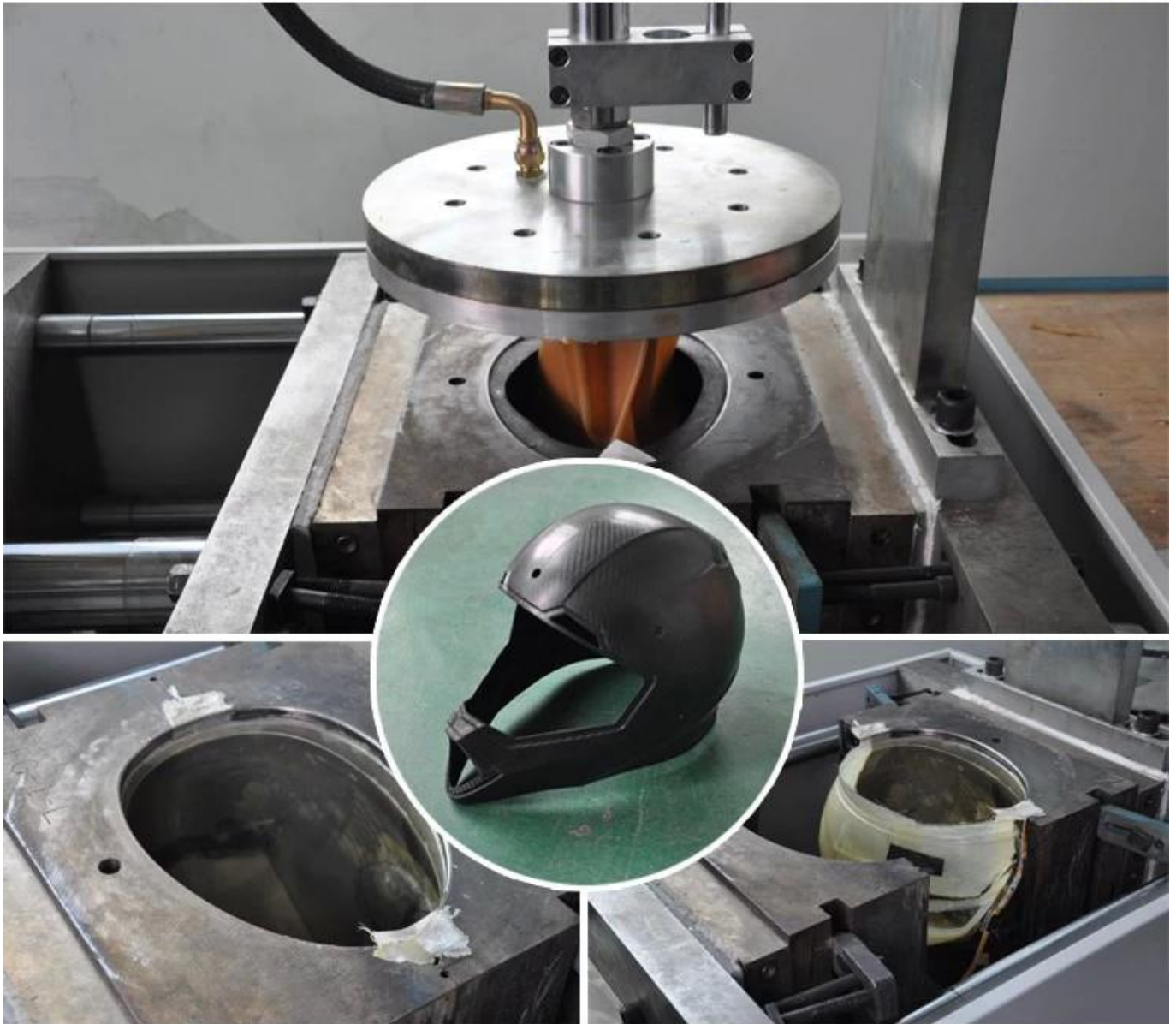
2. Elaborazione dell'autoclave (vuoto insaccato)