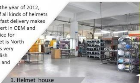
1. Helmet house

Shenzhen Aurora Sports Goods Co., LTD established in the year of 2012, more than 22 years experience. Expert in production of all kinds of helmets for different sports. Excellent quality, reasonable price, fast delivery makes us get very good reputation among our customers. Expert in OEM and ODM orders. Our skilled R&D team offers one stop service for throughout customers. 99% export and our main market is North America, European, Australia, Japan etc. Your enquiry is very welcomed and we will try our utmost to help you establish solid market. We are looking for long term relationship and get win win situation.