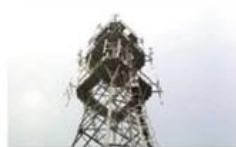
Mobile plant maintenance