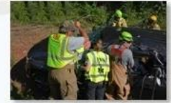
Rescue and evacuation