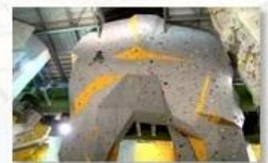
Big wall climbing