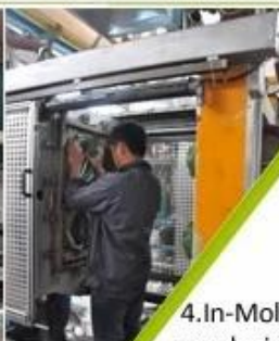
4. In-Mold producing process