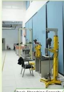
Shock Absorbing Capacity