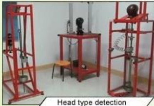
Head type detection