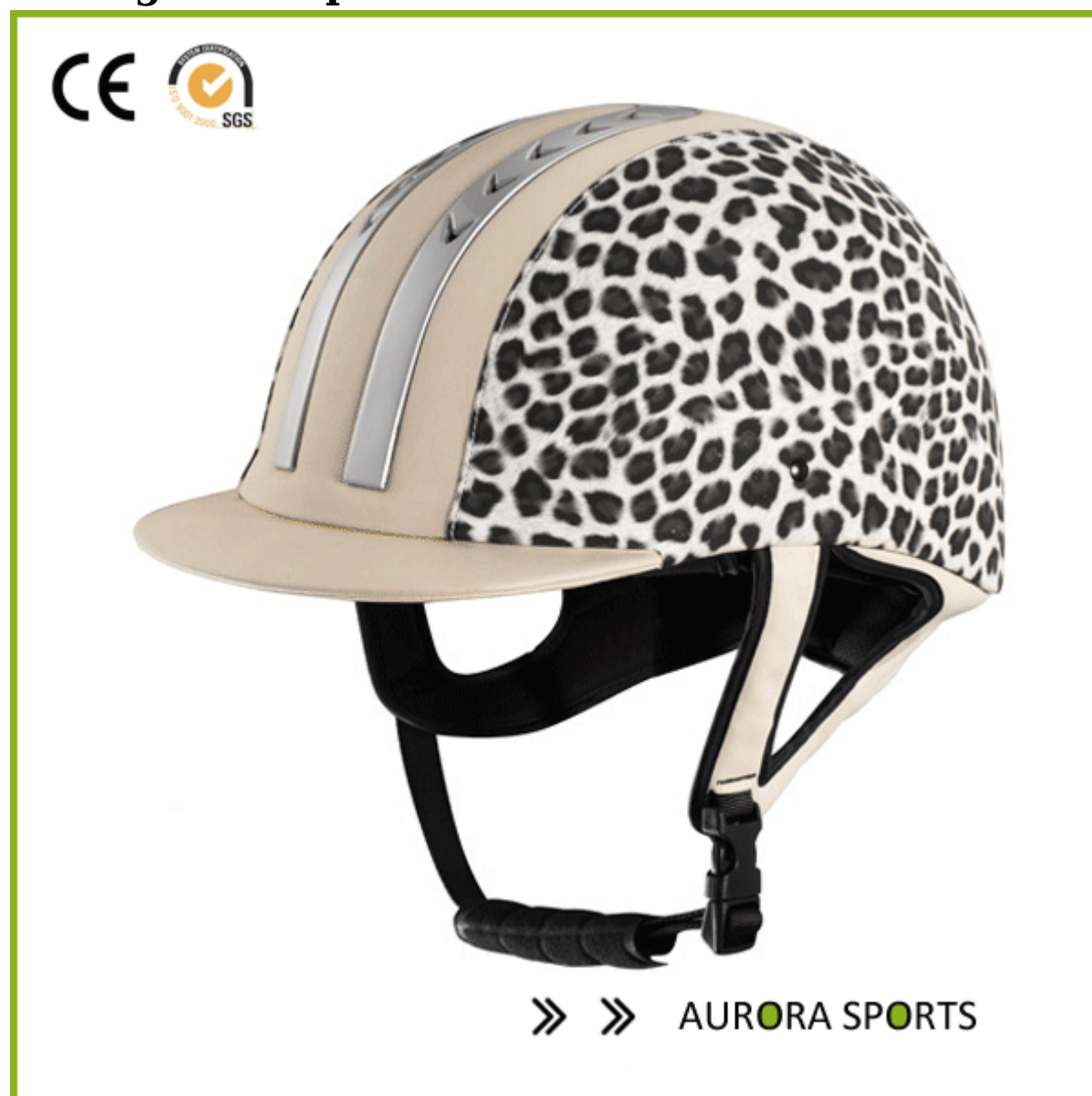
immagine del prodotto

Cina casco supplier offerte Miglior casco per voi!