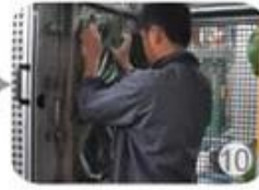
In-mold producing process