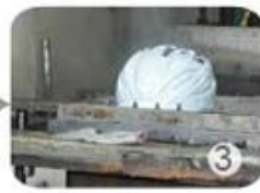
PC blister manufacture