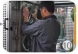
In-mold producing process