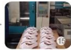
Plastic injection workshop