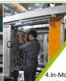
4. In-Mold producing process