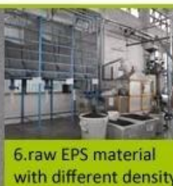
6. raw EPS material with different density