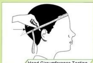
Head Circumference Testing