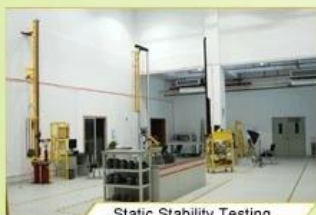
Static Stability Testing

Every manufacturing steps at AURORA follows adhere to strict quality parameters and focus on quality throughout the each stagesinvolved. All raw material and semi finished goods at AURORA pass strict quality control. The finished product, helmets at Aurora is then tested and qualified to export to the world.