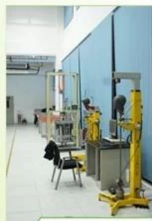
Shock Absorbing Capacity