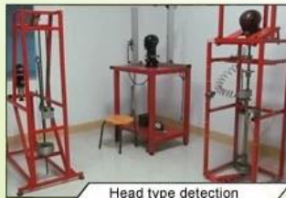
Head type detection