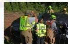
Rescue and evacuation