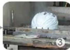
PC blister manufacture