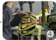
Trimming dug hole