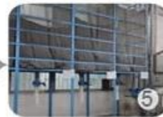
Eps raw material by different density