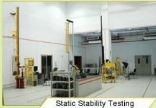
Static Stability Testing

Every manufacturing steps at AURORA follows adhere to strict quality parameters and focus on quality throughout the each stagesinvolved. All raw material and semi finished goods at AURORA pass strict quality control. The finished product, helmets at Aurora is then tested and qualified to export to the world.