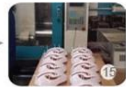
Plastic injection workshop