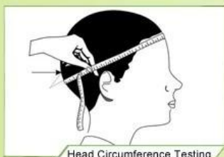
Head Circumference Testing