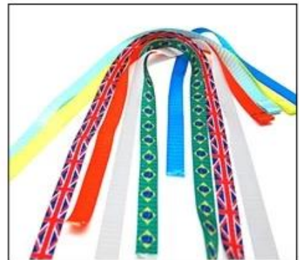
Available colored/patterned strap