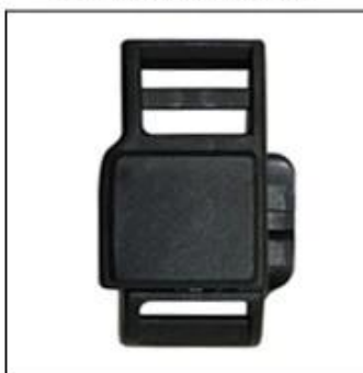
Patent self-developed magnetic buckle