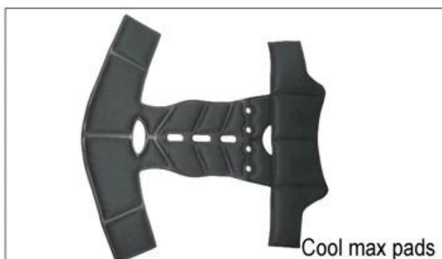
Cool max pads