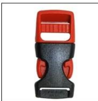
ITW standard helmet buckle