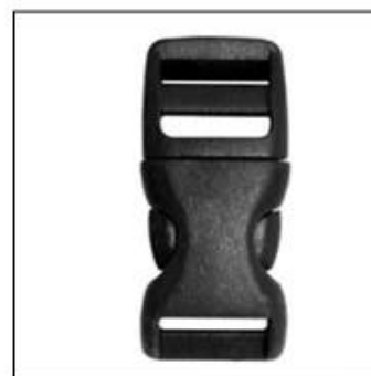
Traditional helmet buckle