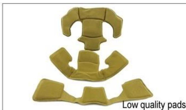
Low quality pads

Traspirazione e comfort sono estremamente importanti, è per questo che il Manta dispone di cinghie Airlite che sono il 15% più leggero di un cinturino casco standard. cinghie Tetonon sono più leggeri, più forte e più traspirante di un normale cinturino del casco. Inoltre non si attaccano al viso con la stessa facilità quando le temperature iniziano ad aumentare. Veloce tessitura Adattamento sistema può essere facilmente e continuamente su misura per la vostra forma esatta testa. Il casco rimane saldamente in testa in tutte le situazioni e le cinghie tessitura sono sempre nella posizione migliore.