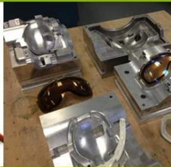
3. Development Stage