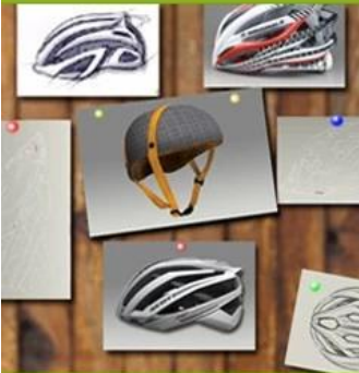
1. Trend predictions

Our in-house design facility coupled with our creative Account team enables us to create innovative helmets ideally suited to our clients target market - the company combines creativity and sourcing in a unique partnership to bring the best to any sports campaign.