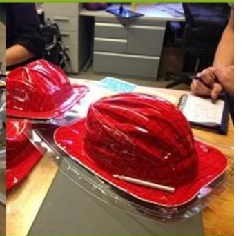
4. Final Production Stage