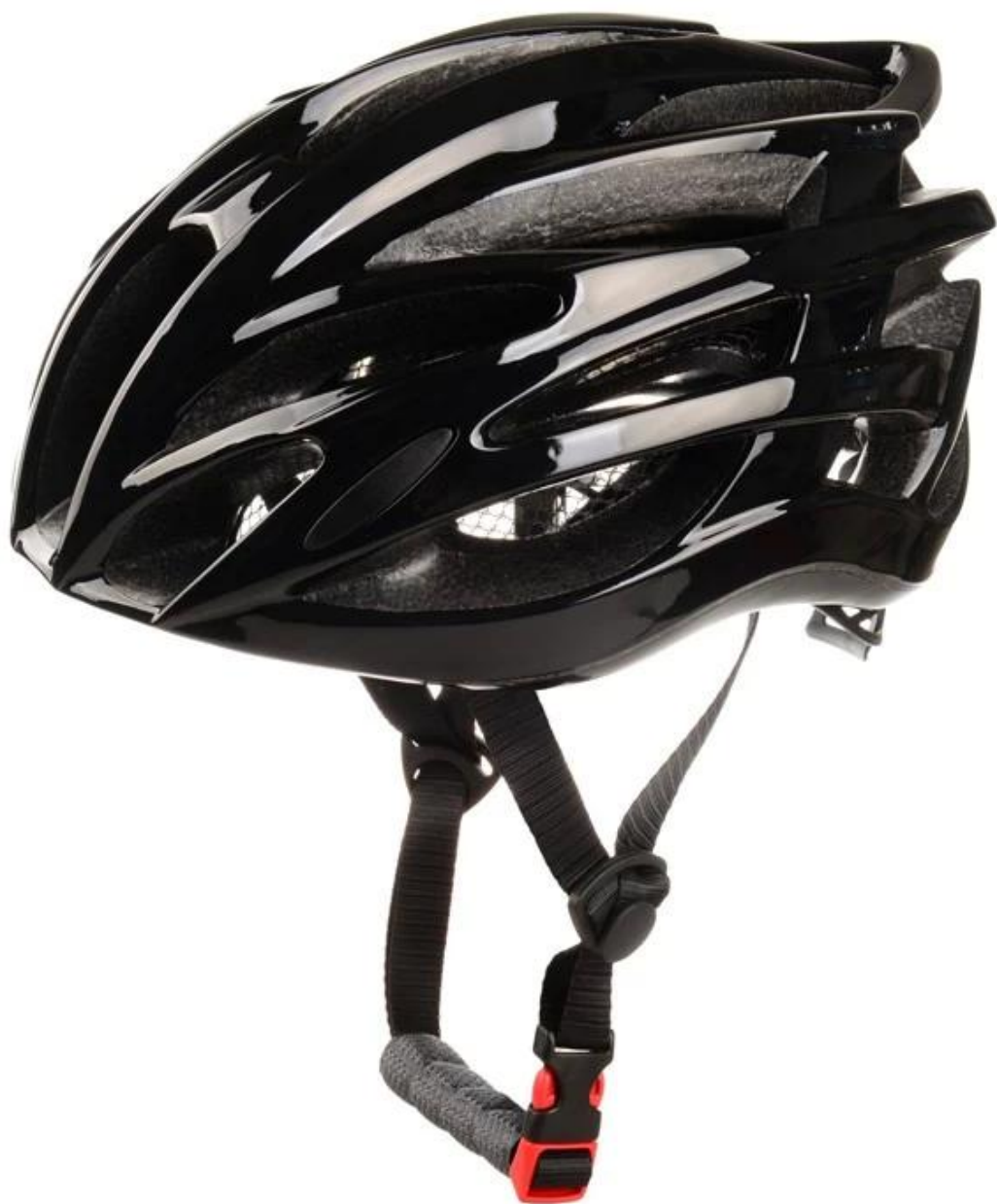
Figure 1 shows the helmet design and its components.