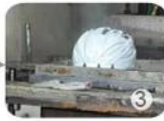
PC blister manufacture