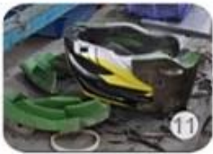
semi-finished In-mold helmet