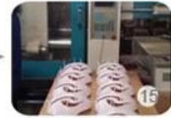
Plastic injection workshop