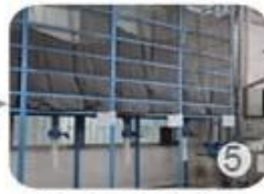
Eps raw material by different density