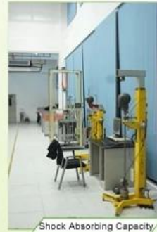
Shock Absorbing Capacity