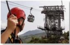
Cable car maintenance