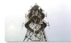
Mobile plant maintenance