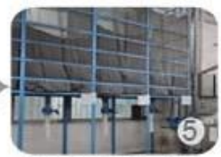
Eps raw material by different density