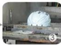
PC blister manufacture