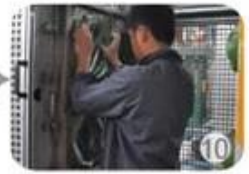
In-mold producing process