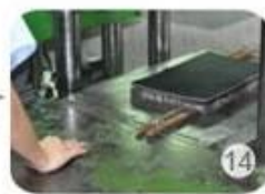
Inner padding production