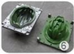
EPS in-mold tooling