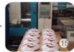
Plastic injection workshop