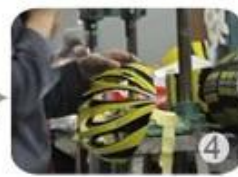
Trimming dug hole