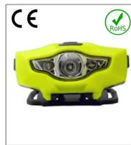
Versatile LED headlight 1A EN 55015: 2006