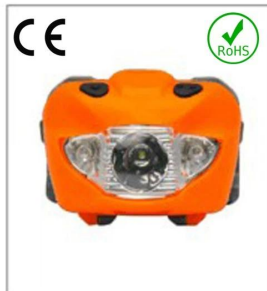
Versatile LED headlight 3A EN 61547:2009