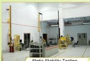
Static Stability Testing

Every manufacturing steps at AURORA follows adhere to strict quality parameters and focus on quality throughout the each stagesinvolved. All raw material and semi finished goods at AURORA pass strict quality control. The finished product, helmets at Aurora is then tested and qualified to export to the world.