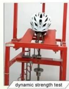
dynamic strength test