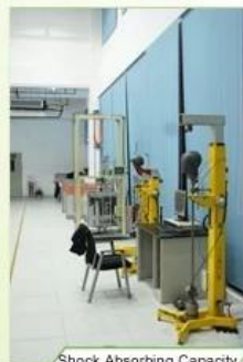
Shock Absorbing Capacity