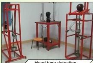
Head type detection