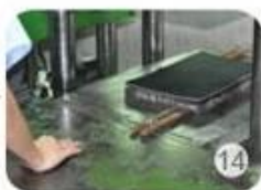
Inner padding production