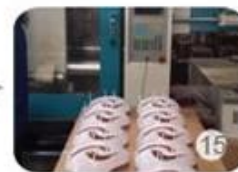
Plastic injection workshop