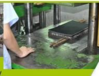
7. Inner padding Production