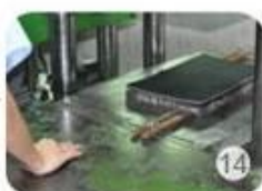
Inner padding production