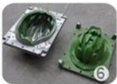
EPS in-mold tooling