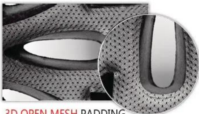
3D OPEN MESH PADDING