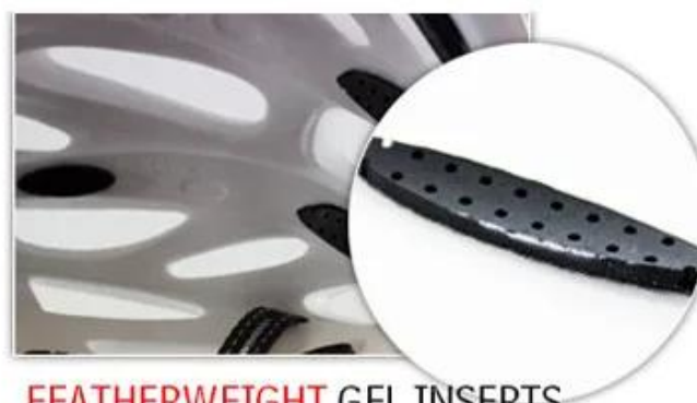
FEATHERWEIGHT GEL INSERTS

Usuwany i prac obicie niealergizujący wykonana z otwartej siatki 3D, zapewnia maksimum Komfort i odprowadza słodkie szybko. Inne opcje, takie jak siatki przeciw owadom & Amp; Chłodny Max® wyściółka może być accevable. "-Moisture-Wicking Podkładki Przechowywać Rider Głowa pralnia