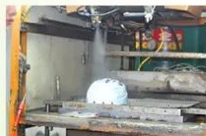
3. PC blister tooling