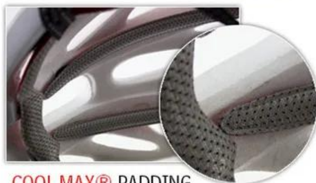
COOL MAX® PADDING