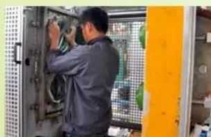
4. In-Mold producing process