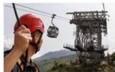
Cable car maintenance