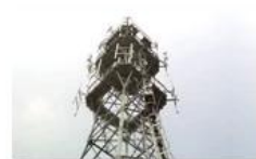
Mobile plant maintenance