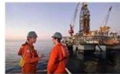
Offshore oil and gas