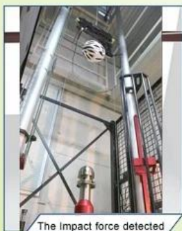
The Impact force detected