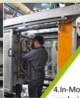
4. In-Mold producing process