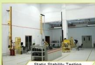
Static Stability Testing

Every manufacturing steps at AURORA follows adhere to strict quality parameters and focus on quality throughout the each stagesinvolved. All raw material and semi finished goods at AURORA pass strict quality control. The finished product, helmets at Aurora is then tested and qualified to export to the world.