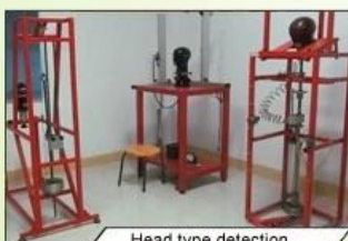
Head type detection