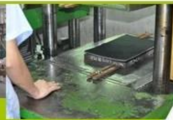
7. Inner padding Production