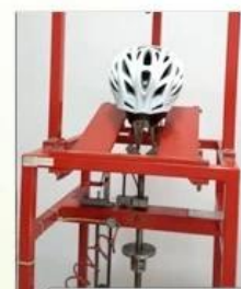
dynamic strength test