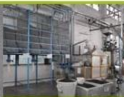
6. raw EPS material with different density