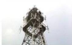
Mobile plant maintenance