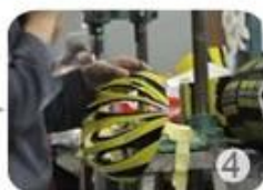
Trimming dug hole