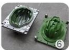
EPS in-mold tooling