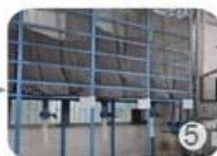
Eps raw material by different density