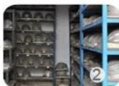
PC blister tooling