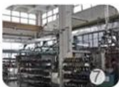
Helmet in-mold workshop