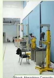
Shock Absorbing Capacity