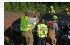
Rescue and evacuation