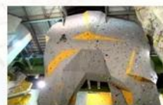
Big wall climbing