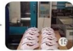
Plastic injection workshop