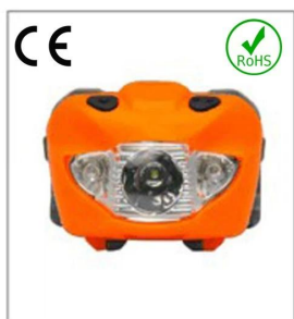
Versatile LED headlight 3A EN 61547:2009