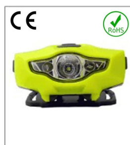
Versatile LED headlight 1A EN 55015: 2006