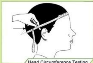
Head Circumference Testing