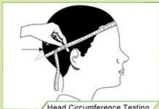
Head Circumference Testing