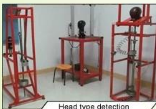
Head type detection