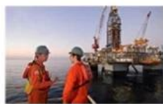
Offshore oil and gas