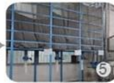
Eps raw material by different density