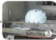
PC blister manufacture