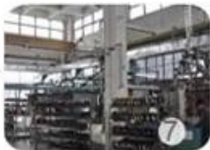
Helmet in-mold workshop