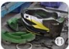
semi-finished In-mold helmet