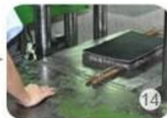
Inner padding production