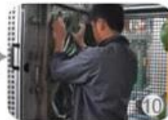
In-mold producing process