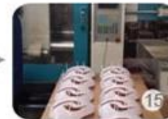
Plastic injection workshop